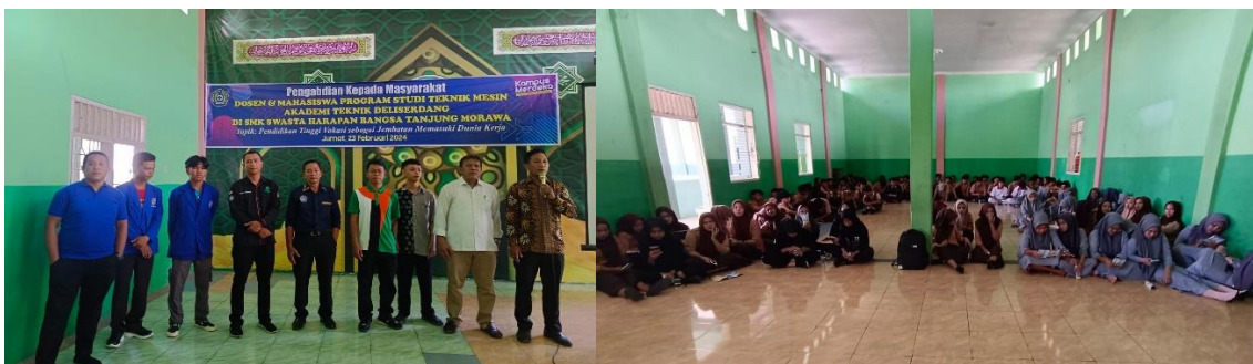
Gambar 2. Dokumentasi Kegiatan PkM di SMK Harapan Bangsa

Kegiatan ini dilaksanakan oleh Dosen dan Mahasiswa Program Studi Teknik Mesin Akademi Teknik Deli Serdang yang merupakan salah satu tugas dari tri darma perguruan tinggi yakni bidang Pengabdian kepada Masyarakat (PkM). PkM ini secara khusus dilaksanakan dan ditujukan kepada siswa kelas 12 SMK Harapan Bangsa Tanjung Morawa Kabupaten Deli Serdang. Dimana Kampus Akademi Teknik Deli Serdang adalah kampus yang terletak di Kecamatan Tanjung Morawa Kabupaten Deli Serdang sehingga menjadi sebuah tanggungjawab moral bagi Kampus ATDS untuk memberikan perhatian melalui pengabdian dan sekaligus bagian dari Konsep Pemerintah/ Kemendikbudristek dengan program Merdeka Belajar Kampus Merdeka (MBKM). Kegiatan ini dilakukan dengan metode kuliah/belajar secara tatap muka dan dialog /tanya jawab.