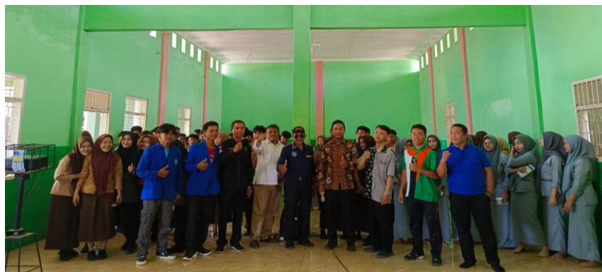
Gambar 3. Siswa SMK Harapan Bangsa dan Tim PkM ATDS berfoto bersama setelah kegiatan